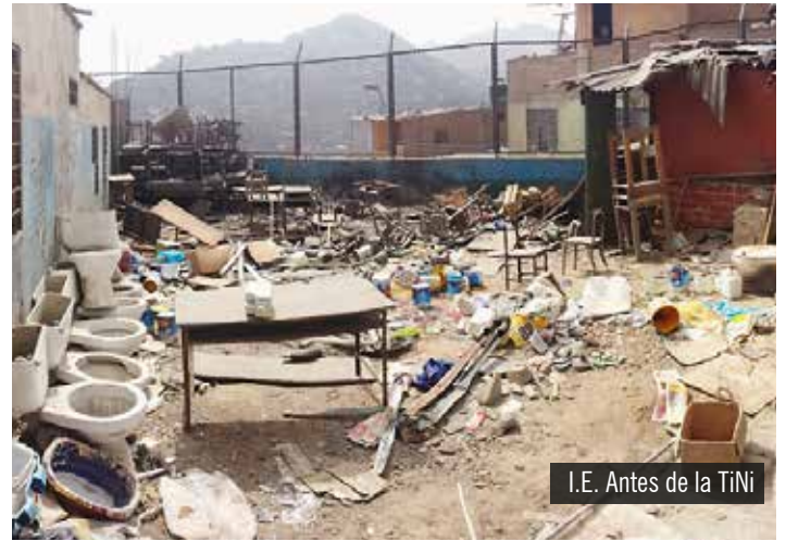
I.E. Antes de la TiNi

En el ámbito de la educación formal, el Estado aún no cuenta con una partida asignada para ayudar al mantenimiento de las EsVi y los esfuerzos de la comunidad educativa son muchas veces superados por factores que van más allá de su control como la escasez del agua, la falta de seguridad, la presencia de plagas y demás. En este contexto el Bono SAVE complementa los esfuerzos locales proveyendo recursos faltantes para que la EsVi se sostenga y con ella se fortalezca la EDS.