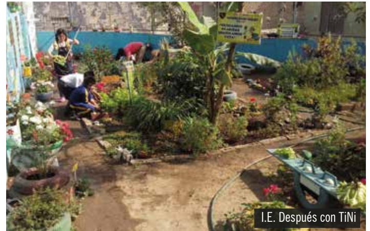
I.E. Después con TiNi