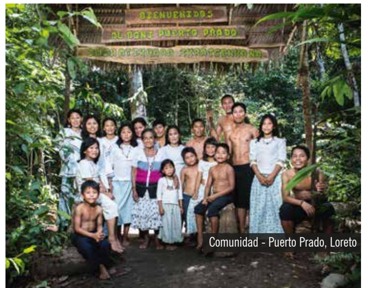
Comunidad - Puerto Prado, Loreto